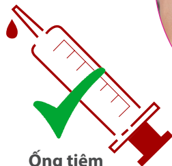
Ống tiêm Chia liều